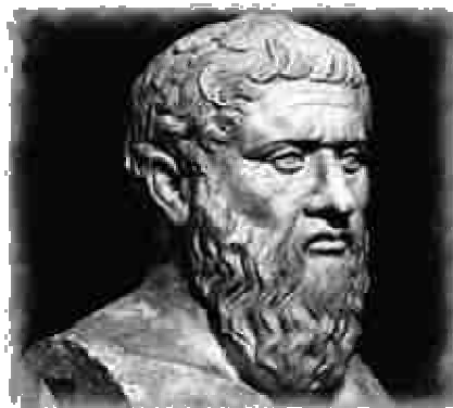
Platon ©2006 CRA DONNELLY

Nous ne connaissons probablement que 100000 ans de l'histoire des techniques, 30000 ans de l'histoire de l'art et à peine 6000 de l'histoire de la politique. Chaque archéologue, figé dans sa discipline, ne va que très rarement « visiter » les disciplines voisines.